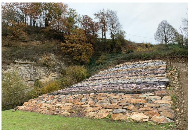
Le mur géologique en novembre 2019

Les périodes géologiques suivantes sont placées avec les mêmes principes de représentativité des roches et de proportionnalité de durée/hauteur.