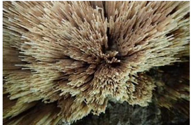
Baguettes de gours

La visite se poursuit jusqu'à une plage, la salle du Sable. Nous aussi, nous avons été à la plage, il y avait moins de soleil mais on a pu dessiner dans le sable et ici, pas d'océan pour effacer nos traces. On casse un peu la dalle (mais