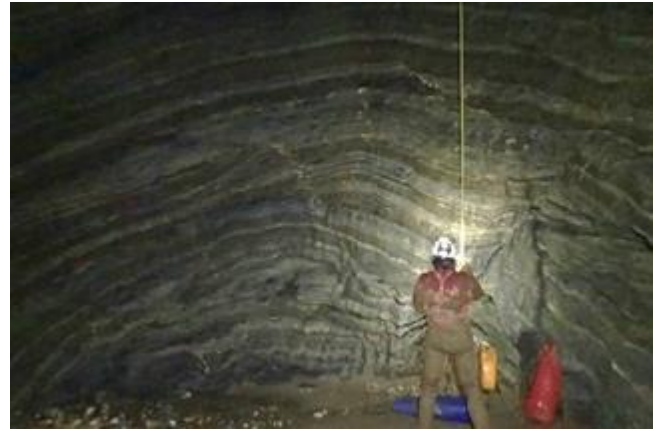
Base du P54

Ensuite, vient le temps de la remontée. Bénédicte y comprendra l'intérêt de la pantin pour