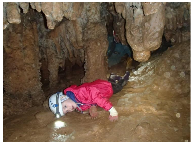
La relève est assurée !

Après un temps certain passé dans la grotte, il est temps de rebrousser chemin car on aura encore pas mal d'effort à fournir pour revenir à la voiture. Une fois sortis de la grotte, on prévient les autres qu'on retourne aux voitures, ils ont fini leur balade mais il y avait vraiment beaucoup de vent sur la crête.