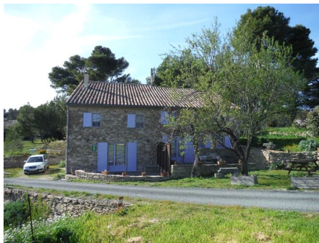
Gîtes de Calamiac

Comme lors de chaque expé, cette semaine a été bien remplie avec au programme de la randonnée (Minerve, Trassanel), des visites touristiques (Carcassonne, le gouffre géant de Cabrespine, les carrières de marbre de Caunes-Minervois, ...), mais surtout de la spéléo. Nous avons eu la chance de visiter deux cavités exceptionnelles : l'Aven du Ruisseau de Castanviels et l'aven des Vents-d'Ange, ainsi qu'une cavité d'initiation où nous avons pu emmener la plus jeune d'entre nous, Eléa.