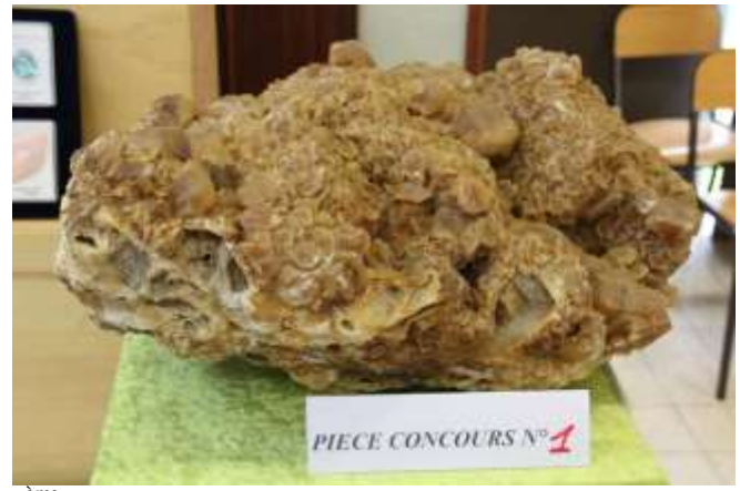
2 ème prix : Hicham HAOUATI - pièce concours n° 27 - fleur de calcite du Maroc : 67 votes