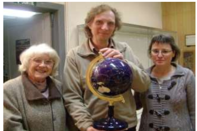
L'heureuse gagnante est venue retirer son lot en nos locaux.