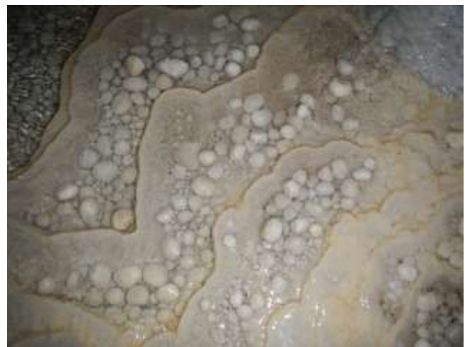
Une "usine" à perle de caverne

voir le Spéléodrome dont nous entendions parler depuis longtemps. Un magnifique spectacle dans une galerie qui a servi autrefois à alimenter la ville de Nancy en eau potable. Nous rejoignons un parking à l'entrée d'un bois, enfilons nos combinaisons (sans néoprène), mettons une corde de 80 mètres sur le dos et partons à pied jusqu'à une trappe cachée par un mur dans le bois. Ensuite, nous descendons le puits sur environ 60 mètres d'une traite, un mètre de diamètre. En bas, nulle part ailleurs (si je ne me trompe), on ne voit autant de perles de cavernes : elles sont des millions, une vraie usine à merveilles ! Les piétiner ne fait d'ailleurs aucun mal au cœur puisqu'elles sont constamment alimentées en calcaire. Les remuer est même une opération indispensable pour éviter qu'elles ne finissent par s'agglomérer en un plancher de calcite.