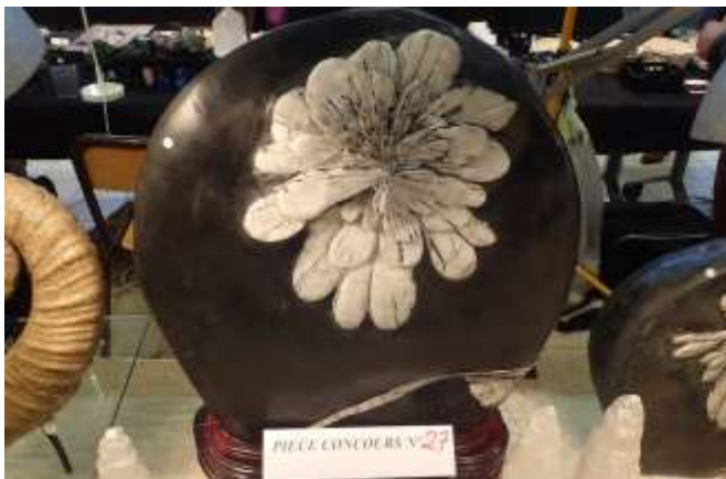
3 ème prix : André KASZTALSKI - pièce concours n° 1 - calcite de Landelies : 65 votes