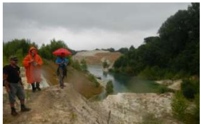
Un des sites visités lors de la balade du 28/06/2014 : une sablière à Oret

28/06/2014 : Balade karstique à Oret organisée par la CWEPPS (Daniel, Pascale, Agnès, Henri, Philippe P. et Valérie).