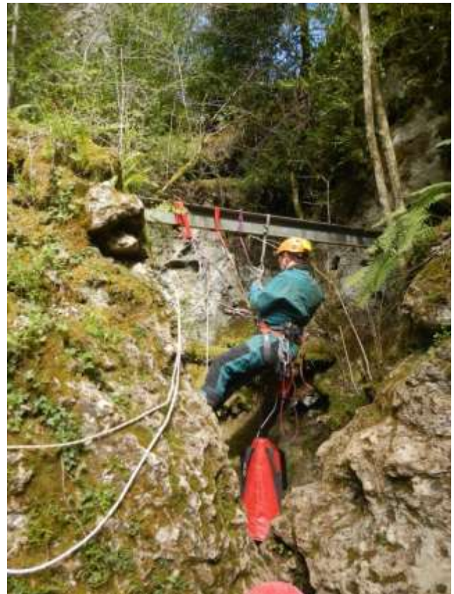
Laurent équipe l'entrée de Valat Nègre

remarquables, et il ne reste déjà plus qu'à remonter.